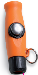
Ø 1/4" GAS BSPT